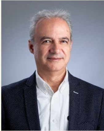
PAR M. RICARDO GABALDÓN GABALDÓN Maire d'Utiel, Espagne

On doit préconiser l'élaboration de protocoles appropriés, spécifiques et détaillés pour les petites municipalités qui permettent une réponse rapide aux événements critiques ou catastrophiques, compte tenu du manque ou des ressources limitées disponibles dans ces administrations territoriales.